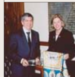
La Presidenta del Foro Interparlamentario de las Américas (FIPA), la Senadora Hervieux-Payette reconoce, en nombre del FIPA, el Aporte del Secretario General de la OEA al Fortalecimiento del Papel del Poder Legislativo en las Américas - octubre de 2003.

A nivel interamericano se ha apoyado al Foro Interparlamentario de las Américas (FIPA) que tiene como objetivo crear un ambiente en el cual se compartan entre legisladores del Hemisferio las experiencias y mejores prácticas parlamentarias en busca del fortalecimiento del papel del poder legislativo en la democracia y la integración. El FIPA ha celebrado tres reuniones desde