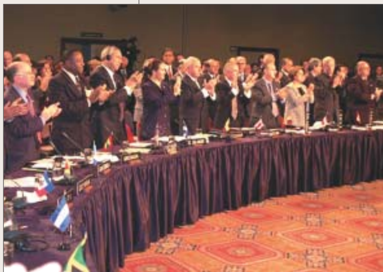
Los Cancilleres reunidos aprueban la Carta Democrática Interamericana. Lima-Perú, 11 de septiembre del 2001.

Las negociaciones de la Carta Interamericana se realizaron en el marco de la OEA con la participación de los 34 Estados miembros y con un aporte importante de las organizaciones de la sociedad civil. La firma de la Carta se realizó durante la Asamblea Extraordinaria celebrada en Lima, Perú, la mañana del 11 de septiembre de 2001 luego que los Ministros de Relaciones Exteriores fueron informados de los ataques terroristas en Nueva York y Washington D.C. El momento de firma de este valioso instrumento será recordado como un hito en el proceso de fortalecimiento y defensa de la democracia y como un episodio que demuestra el apoyo colectivo y la solidaridad de los países de las Américas.